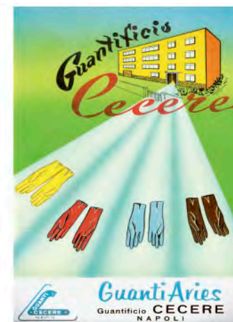
Illustrazione pubblicitaria per cartella colori. Napoli anni '50.

The gloves factory in Neaples. Illustration from 1950.